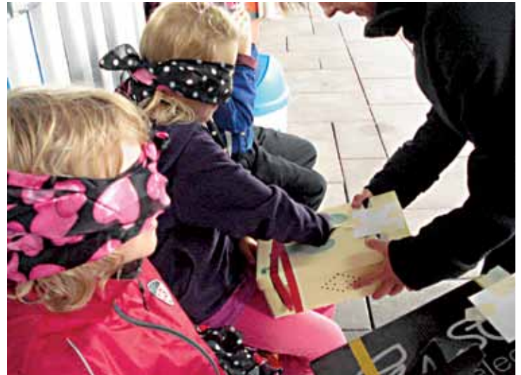
Der geheimnisvolle Schuhkarton

der geheimnisvolle Schuhkarton waren Aufgaben die es zu bewältigen galt.