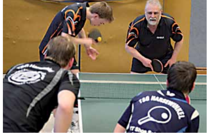
Das Auftakt-Doppel der ersten Herren gegen SV Brackwede V, welche wir mit 9:4 gewannen und uns dadurch vorzeitig den Klassenerhalt sicherten.