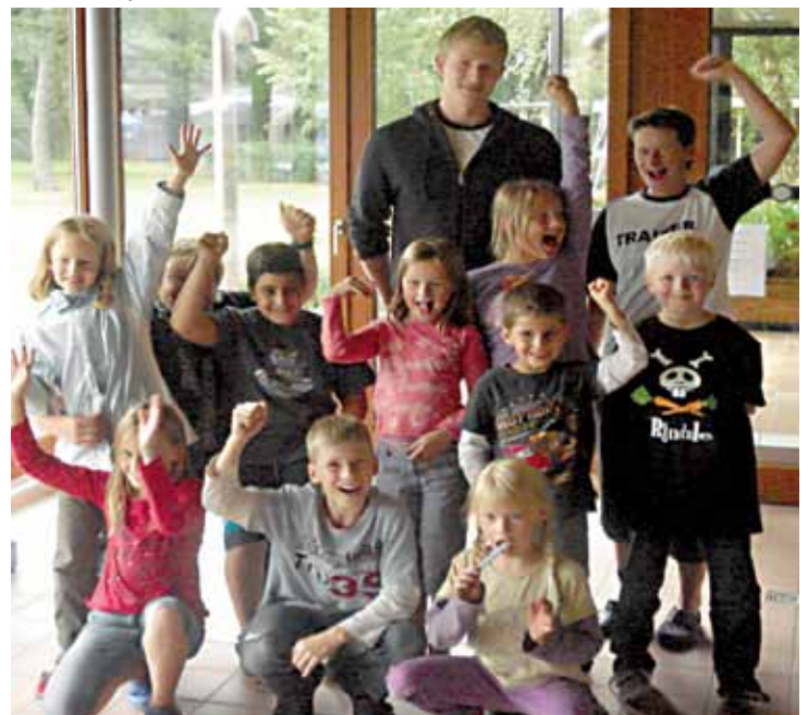
Die 3 Siegermannschaften mit ihren Teamleitern

Die kleine Stärkung, die es nach der Siegerehrung gab, hatten sich aber alle verdient! Mit der Hoffnung auf besseres Wetter wollen wir dann nächstes Jahr aber auch wieder im Wasser spielen.