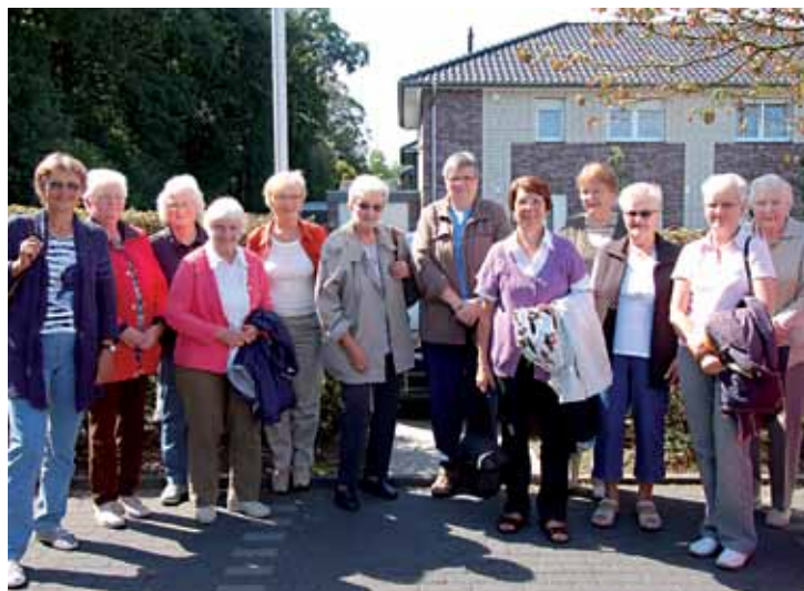
Gruppenbild der Damen der Dienstagsgruppe (nach dem Frühstück)

So hat zum Beispiel die Dienstagsgruppe der Damen den Start der Sommerferien mit einer kleinen Radtour und einem ausgiebigen Frühstück zelebriert. Die Männer der Montagsturner trafen sich kurz vor den Ferien im Hühnerstall am Heimatmuseum in Marienfeld. Aktionen in der Gruppe außerhalb der Turnhalle festigen den Zusammenhalt der Teilnehmer. Nähere Informationen zu unseren Gruppen sind auf unserer Internetseite oder bei Claudia Stanjek zu erhalten.