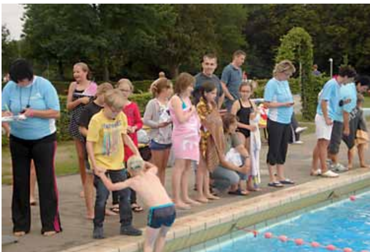
Zeitnehmer und Fans warten im Ziel

Mit 108 Meldungen für das Volksschwimmen, 16 Staffelmansschaften und 26°C bei strahlendem Sonnenschein war es dann auch eine gelungene Veranstaltung. Viele Teilneh-